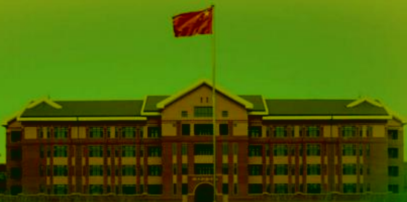
天津机电职业技术学院

TIANJIN VOCATIONAL COLLEGE OF MECHANICAL AND ELECTRICAL ENGINEERING